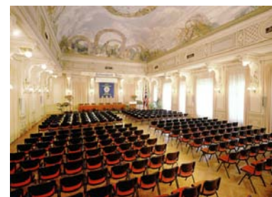
Sala delle Cariatidi